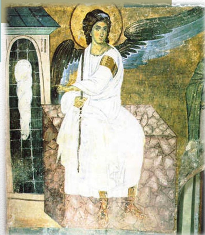
Фреска Бели анђео