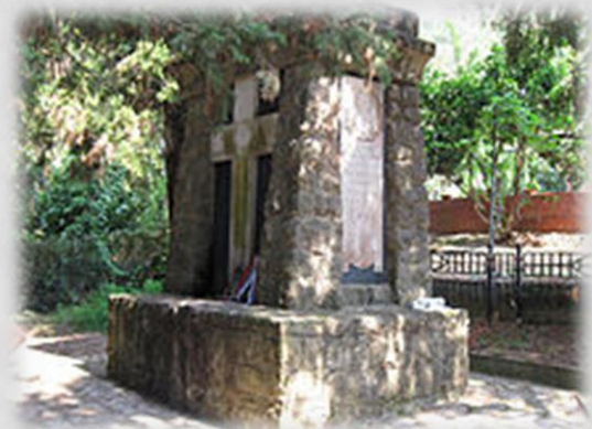
Споменик на гробљу српских војника у близини места Агиос Матос на острву Крф.