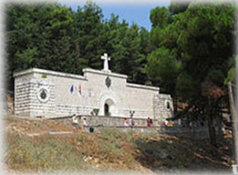
Маузолеј на острву Виду.